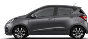
STAR DUST (V3G - METALIK)