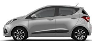
NEW SLEEK SILVER (RYS - METALIK)