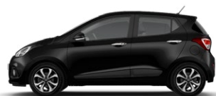
PHANTOM BLACK (X5B - PERŁOWY)