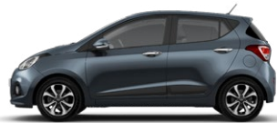
AQUA SPARKLING (W3U - METALIK)