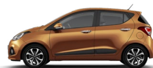
MANDARIN ORANGE (T5A - PERŁOWY)