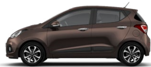
CASHEMERE BROWN (X9N - METALIK)