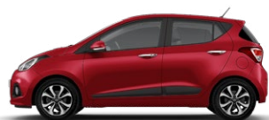
RED PASSION (X2R - PERŁOWY)