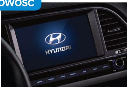
Nawigacja - 2990 zł