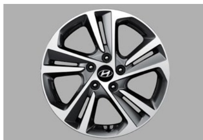
Felgi 17" - 1000 zł