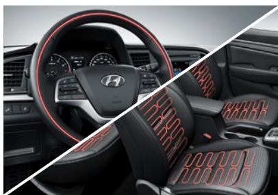
Pakiet zimowy - 1000 zł